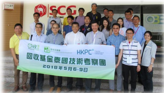
▲泰國技術考察團參觀當地回收再造紙工廠。

為了協助回收業界開拓市場及尋找更多元化的出路，回收基金秘書處已於今年5月舉辦了一個泰國技術考察團，讓業界與泰國相關的政府部門會談，了解貿易法規和市場資訊。此外，透過訪問當地回收再造紙及塑膠製造工廠，與泰國廠商溝通及商討未來合作，促進兩地業界人仕交流。有關考察團的報告已上載至以下網址以供參閱： https://www.recyclingfund.hk/images/events/events_57_t.pdf