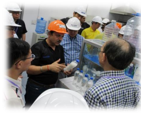
▲參觀塑膠回收再造工廠，技術人員為團員講解塑膠樽製造過程。